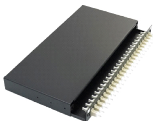
A. Tiroir coulissant

Les panneaux de connexion LC Excel sont des boîtiers de type « plateau », à tiroir coulissant, adaptés au raccordement direct ou par épissure de 48 fibres maximum par unité d'espace rack. Chaque panneau est fabriqué en acier haute qualité, d'une épaisseur de 2 mm, et recouvert d'une peinture en poudre noire, garantissant solidité et durabilité. Le nombre spécifié d'adaptateurs duplex est installé à l'avant du panneau de connexion, de gauche à droite. La face avant contient également les dispositifs de déblocage du tiroir coulissant. Chaque panneau utilise des adaptateurs identifiables par leur couleur : beige pour multimode et bleu pour monomode. Chaque adaptateur duplex peut recevoir deux fibres raccordées et chaque panneau comprend un jeu de bras de fixation réglables, ainsi qu'un kit de rangement des câbles (presse-étoupes, serre-câbles et pont de raccordement par épissure 24 voies).