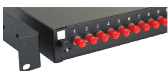
C. Bras de fixation réglables. Étiquetage clair des ports et du panneau.