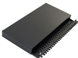
A. Tiroir coulissant

Les panneaux de connexion ST Excel sont des boîtiers de type « plateau », à tiroir coulissant, adaptés au raccordement direct ou par épissure de 24 fibres maximum par unité d'espace rack. Chaque panneau est fabriqué en acier haute qualité, d'une épaisseur de 2 mm, et recouvert d'une peinture en poudre noire, garantissant solidité et durabilité. Le nombre spécifié d'adaptateurs simplex est installé à l'avant du panneau de connexion, de gauche à droite. La face avant contient également les dispositifs de déblocage du tiroir coulissant. Chaque adaptateur est doté d'un cache-poussière identifiable par sa couleur : noir pour multimode, rouge pour monomode. Chaque adaptateur simplex peut recevoir une fibre raccordée et chaque panneau comprend un jeu de bras de fixation réglables, ainsi qu'un kit de rangement des câbles (presse-étoupes, serre-câbles et pont de raccordement par épissure 24 voies).