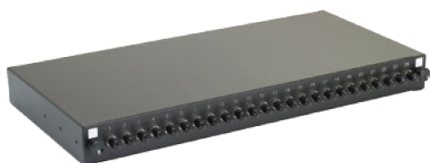
B. Panneaux partiellement ou entièrement équipés