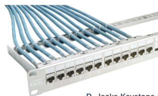
D. Jacks Keystone montés dans un panneau de connexion chrome, n° de pièce 100-028