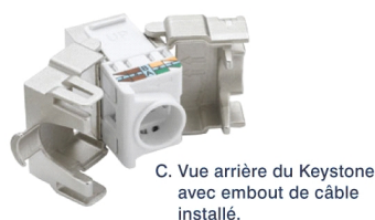
C. Vue arrière du Keystone avec embout de câble installé.